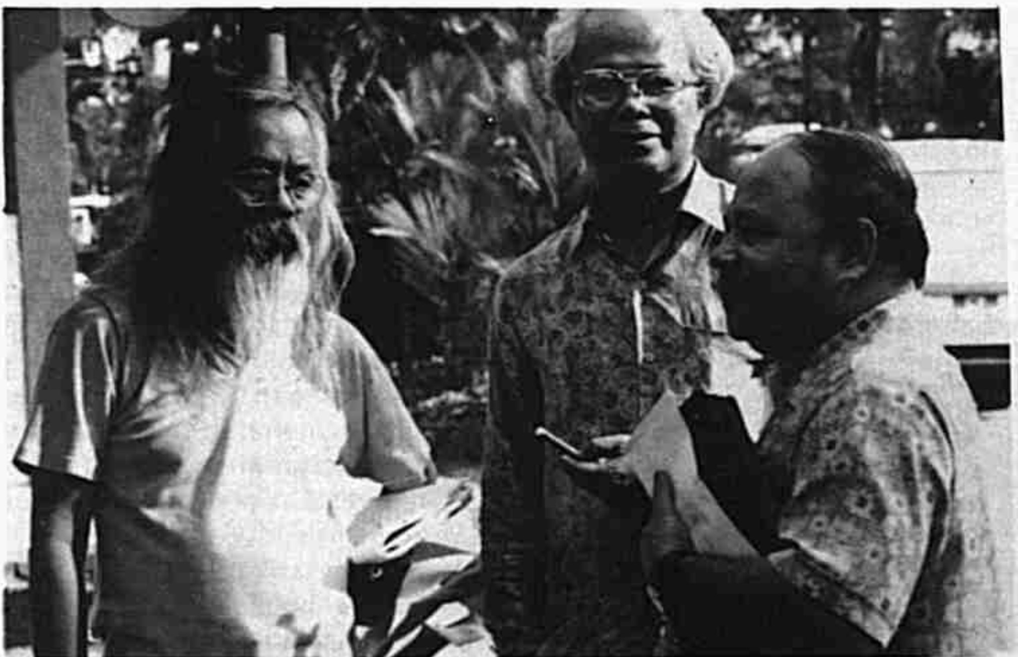
Ketua Satu dan Setiausaha Satu GAPENA berbincang sesuatu dengan Sasterawan Negara A. Samad Said AJK GAPENA 1986-88.