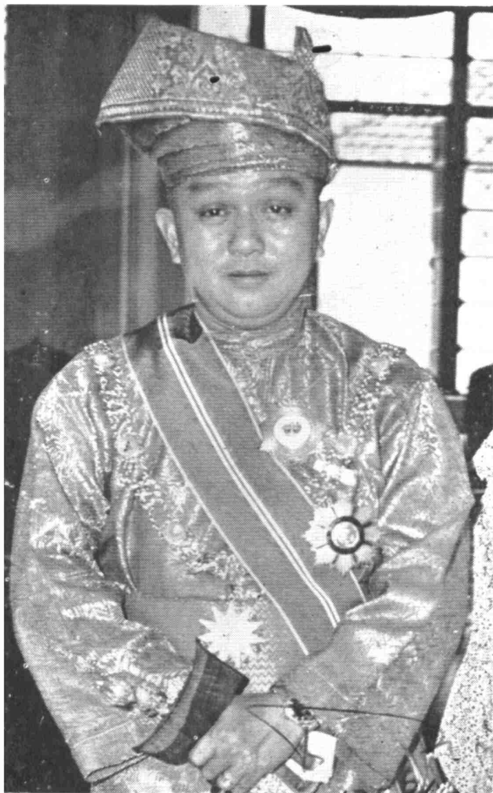
Duli Y.M.M. Tuanku Munawir S.M.N., S.P.M.B. Gambar 1959.