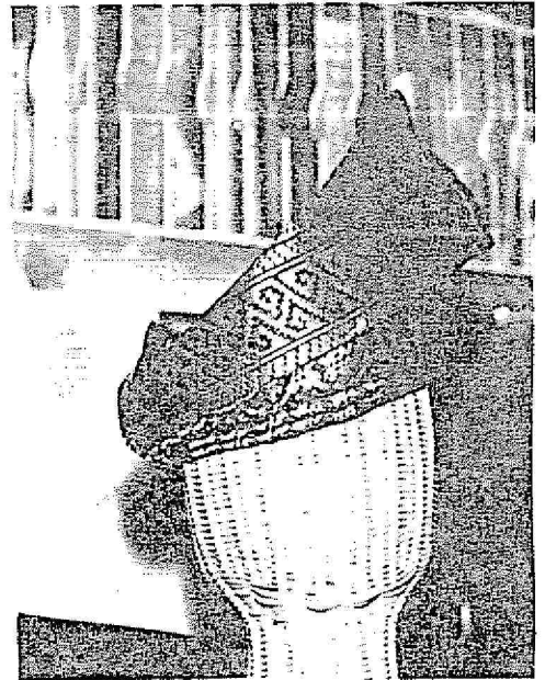
HIASAN-HIASAN KEPALA LELAKI DAN WANITA KAUM MINANGKABAU