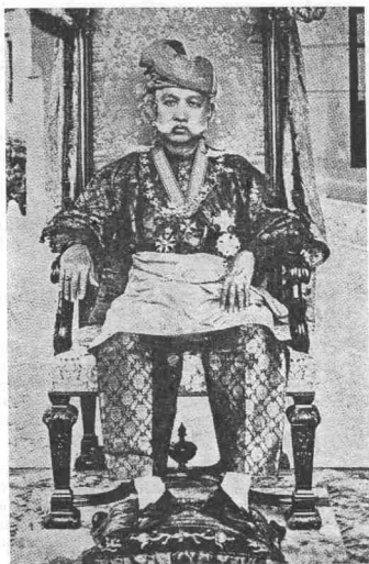
Almarhum Tuanku Muhammad Shah, Raja Negeri Sembilan YANG KETUJUH.