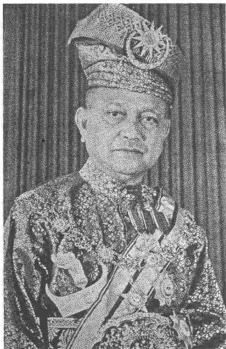
Almarhum Tuanku Abdul Rahman ibni almarhum Tuanku Muhammad, Raja Negeri Sembilan YANG KEDELAPAN.