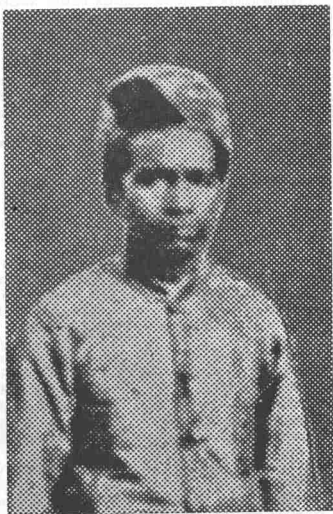
Almarhum Tuanku Antah, Raja Negeri Sembilan YANG KEENAM.