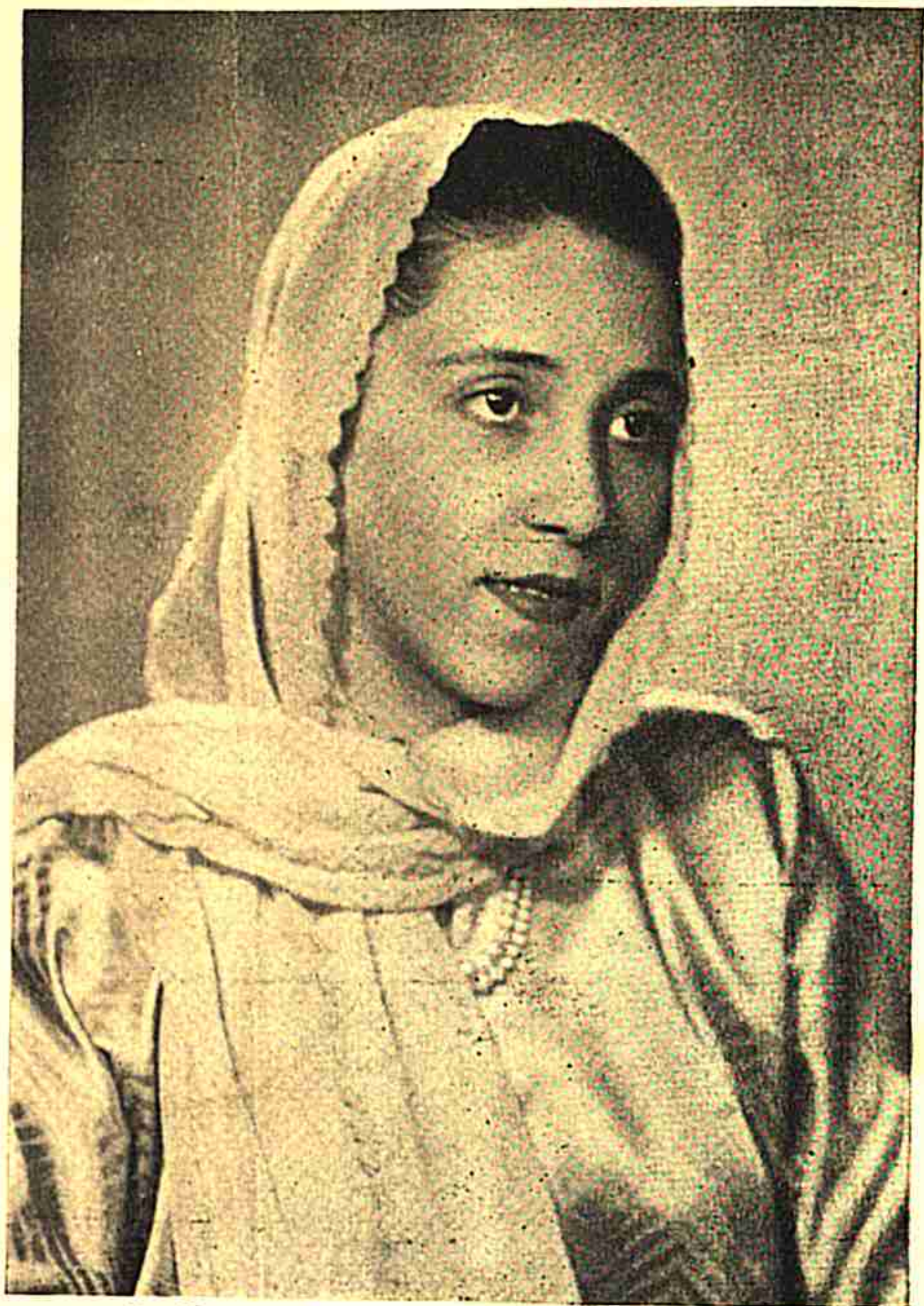
» بگنیله اگن چارا فرمفوان ۲ دیغافورا مگوناکن تودوغن « - فیکر نظیفه ددالم داتین .