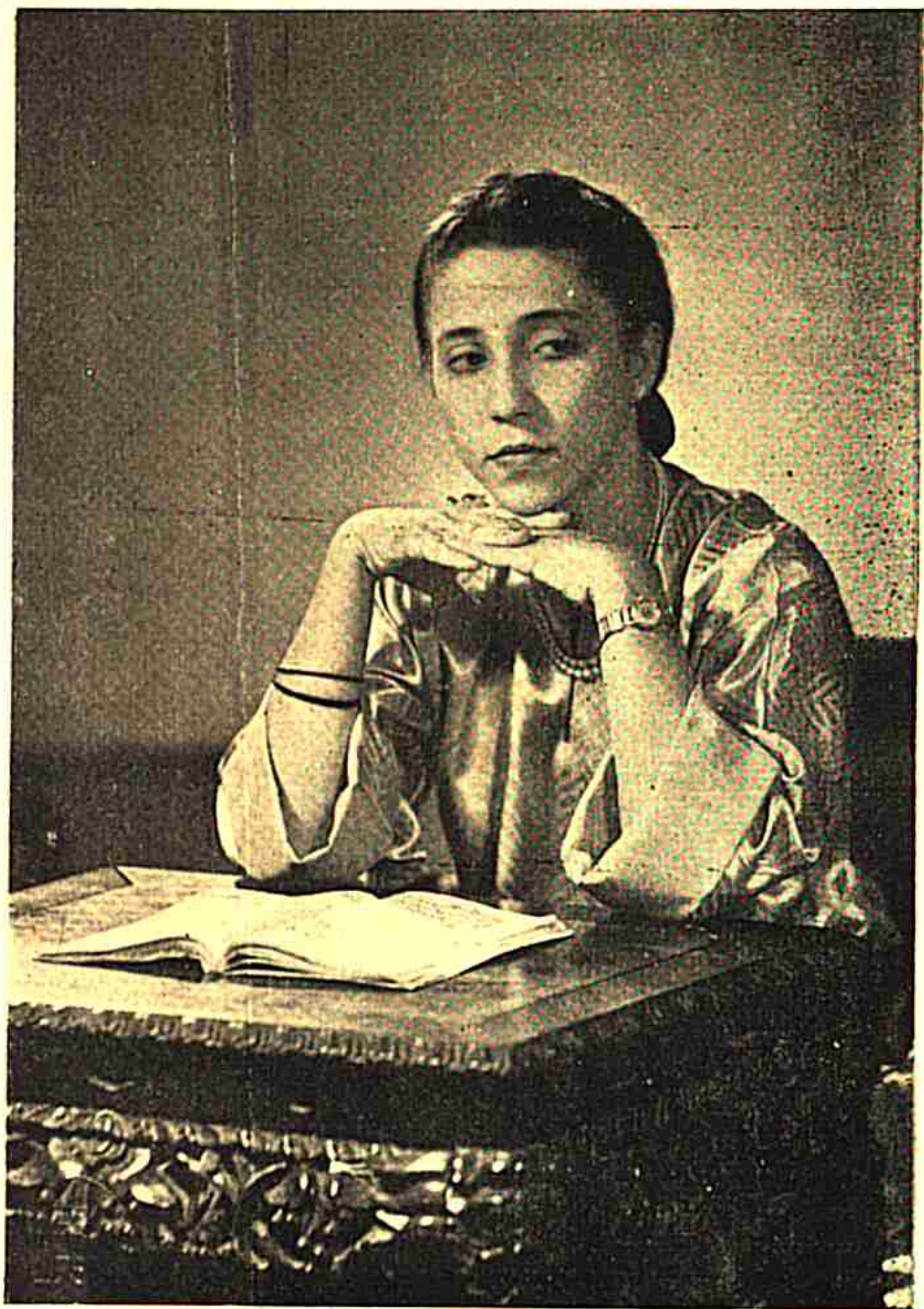
افيل دكتورين سماج يغمق اغكتن اكن فركي كسيغافورا مك ايفون تيدق تتولاكي بلاجر.