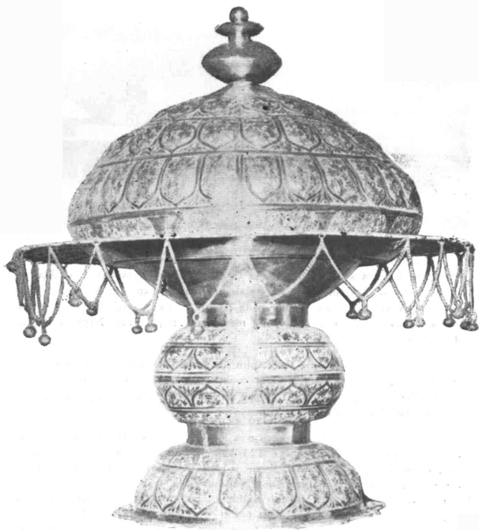
Dulang berkaki yang di-gunakan dalam semua istiadat di-Raja Negeri Sembilan.