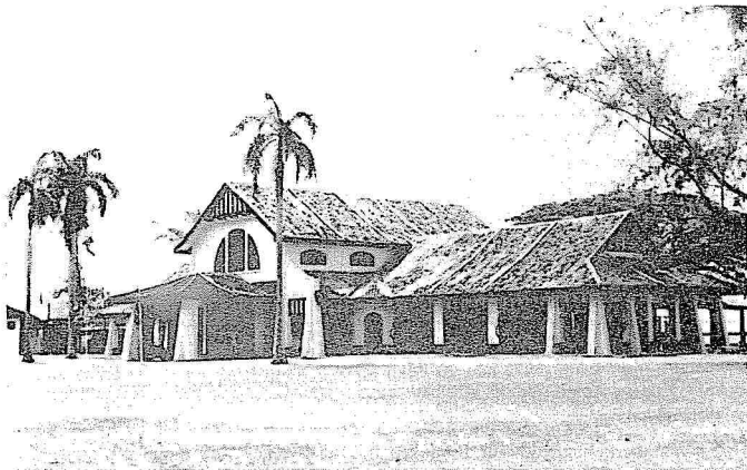
Bangunan lama di mana Sekolah Menengah Ingeris Port Dickson ditempatkan pada tahun 1919. Bangunan ini sekarang digunakan oleh Sekolah Rendah Port Dickson.