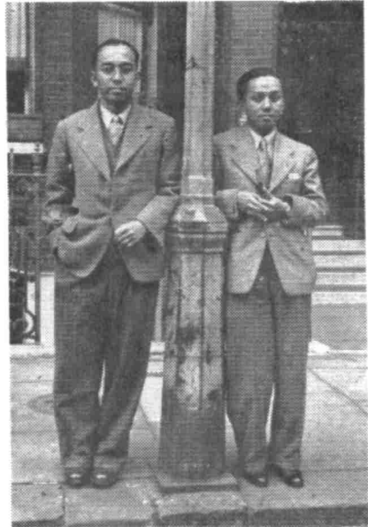
Dengan Tun A. Razak di-England 1947.