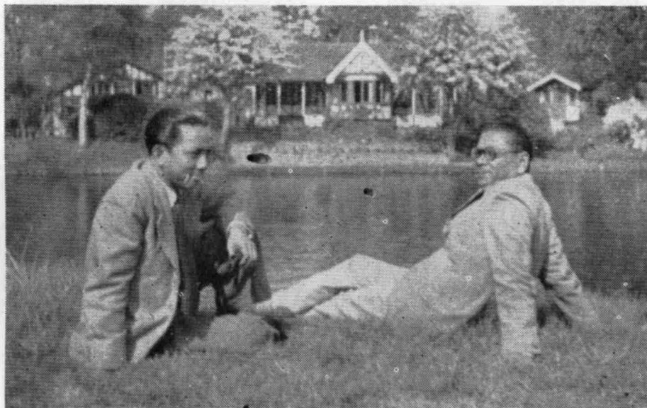
Dengan Y.T.M. Tunku Abdul Rahman Putra di-England pada tahun 1947.