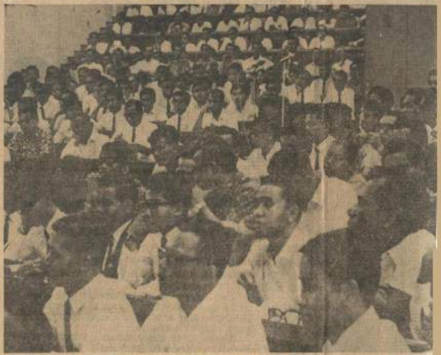
● Sa-bahagian dari lebih 400 orang yang memenuhi kuliah Fakulti Pendidikan, Universiti pembukaan Kongres Universiti Kebangsaan pagi semalam.

35 orang 'ahli' dan tokoh untok Majlis Universiti kelak