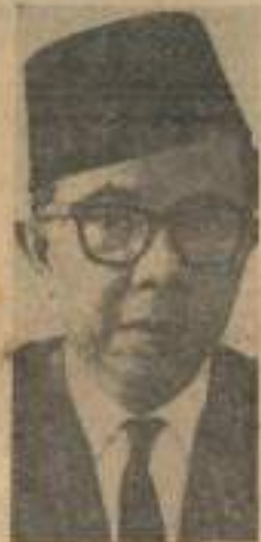
TAN SRI SUFFIAN Ketua Gabal Perlembagaan

Tepokan kedengaran menyambut pengumuman itu dari lebih 600 orang hadirin, termasuk wakil2 kedutaan2 asing, pegawai2 tinggi Kerajaan dan perwakilan2 dari pelbagai badan seluruh Malaysia.