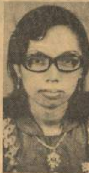
MASHKURAH "Keluarga miskin"

Sementara itu 70 orang dari 105 orang pelajar lelaki perempuan telah mendaftarkan diri untuk belajar dalam tingkatan enam (bawah) di-Kolej Islam hari ini.