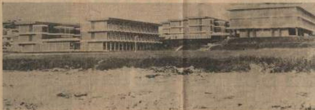
Snopunan di-atas m-lah bangunan Kolej Islam di-Petaling Jaya, dan bangunan ini akan di-jadikan Universiti Kebangsaan

Kalau hari ini ana- sir2 politik membuat chogan kata: "Sijil Me- layu sa' laku" maka masa-nya akan tiba pu- la dalam mana ana-sir2 ini juga akan menge- luarkan chogan kata