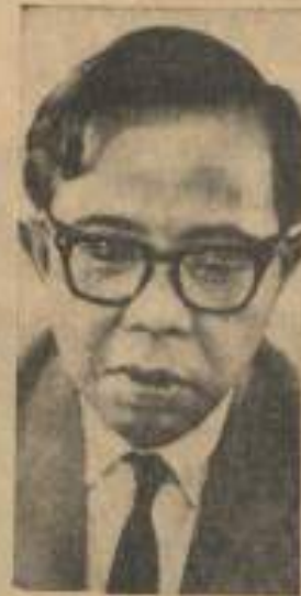
TAN SRI SUFFIAN Ketua Pengubah Perlembagaan