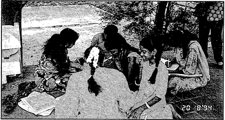
Pelajar-pelajar Universiti ini sedang membuat Tesis mereka di bawahpokok di hadapan sebuah Kuil Hindu. Ada pelajar dalam bidang perubatan, Undang-Undang dan Pertanian

Mengikut peredaran masa penakluk kulit putih ini secara perlahan-lahan meresap masuk dalam kebudayaan tempatan. Peraturan-peraturan adat, Puja Dewa-Dewa dijadikan agama. Dan hal ini pedanda atau Sami-sami mempunyai tugas yang penting. Hanya Sami-Sami ini yang mempunyai peranan penting dapat melaksanakan peraturan-peraturan dan melaksanakan ritual keagamaan dan mempunyai peranan sebagai orang perantara dengan dewa-dewa. Manakala Kasta Ksyatria yang tidak mempunyai kuasa dan pengetahuan dalam hal ini terpaksa tunduk kepada Kasta Brahman. Akhirnya Kasta Brahman lebih tinggi martabatnya atau golongan pemerintah. kasta Brahman juga mengamalkan perkahwinan sesama suku. Kemudianya dalam beberapa abad kemudian ia menjadi kebiasaan dan sebagai rukun kehidupan di kalangan orang-orang India.