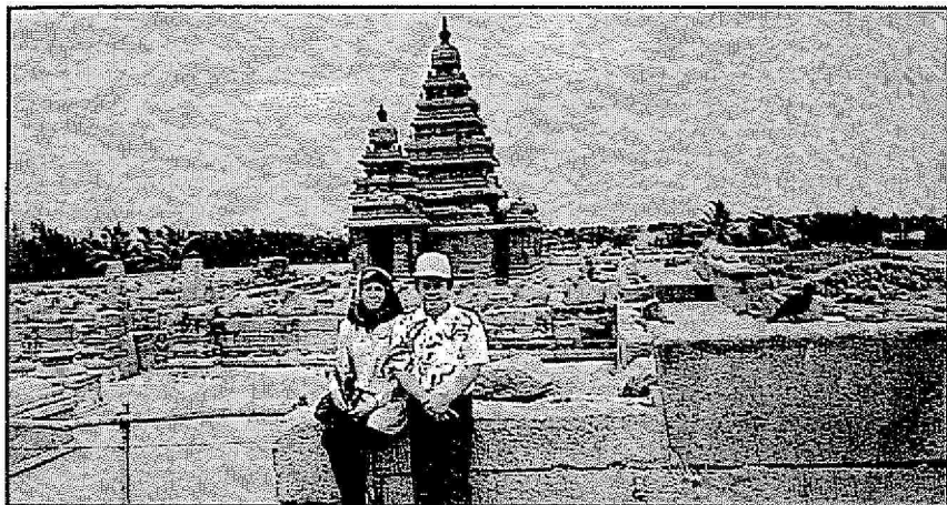
Di Selatan India, bangunan yang kerap kelihatan, paling besar dan paling tinggi ialah Kuil-Kuil Hindu