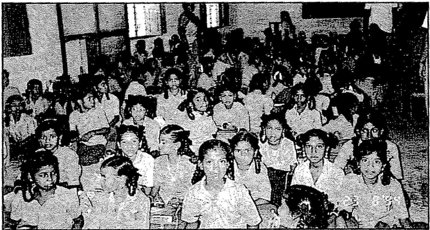
Pemandangan Salah Sebuah Bilik Darjah Sekolah Rendah Kerajaan. Mereka belajar hanya bersela dilantai. Tiada perabut dibekalkan.

Kasta adalah satu kumpulan sosial, di mana anggota-anggotanya ditentukan oleh taraf kelahiran masing-masing.