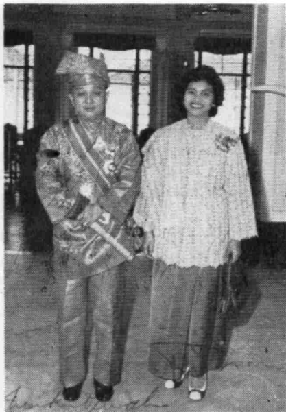
Bergambar dengan Tuanku Ampuan 1959.