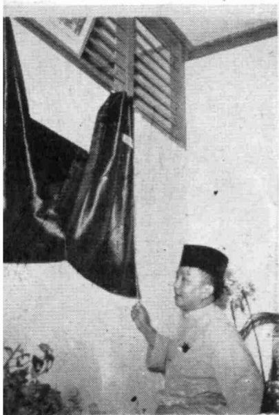
Y.M.M. membuka dengan resmi Pejabat Talikom yang baharu di-K. Pilah 1958.