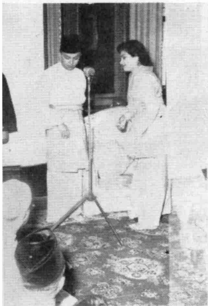
Dalam istiadat melantek isteri Baginda menjadi Tuanku Ampuan Muda di-Istana Besar Seri Menanti pada 6.10.1957.