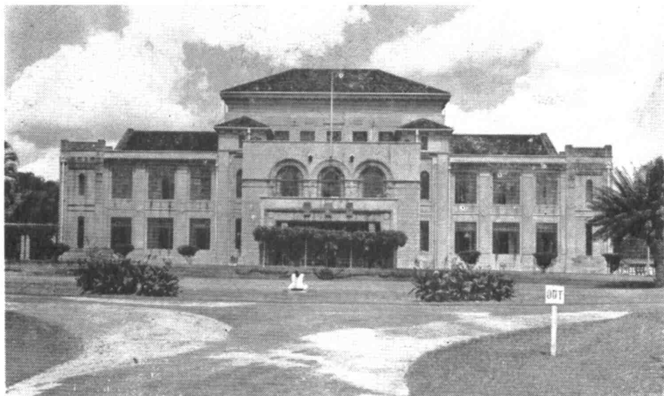
Istana Besar Seri Menanti di-pindahkan pada tahun 1930.