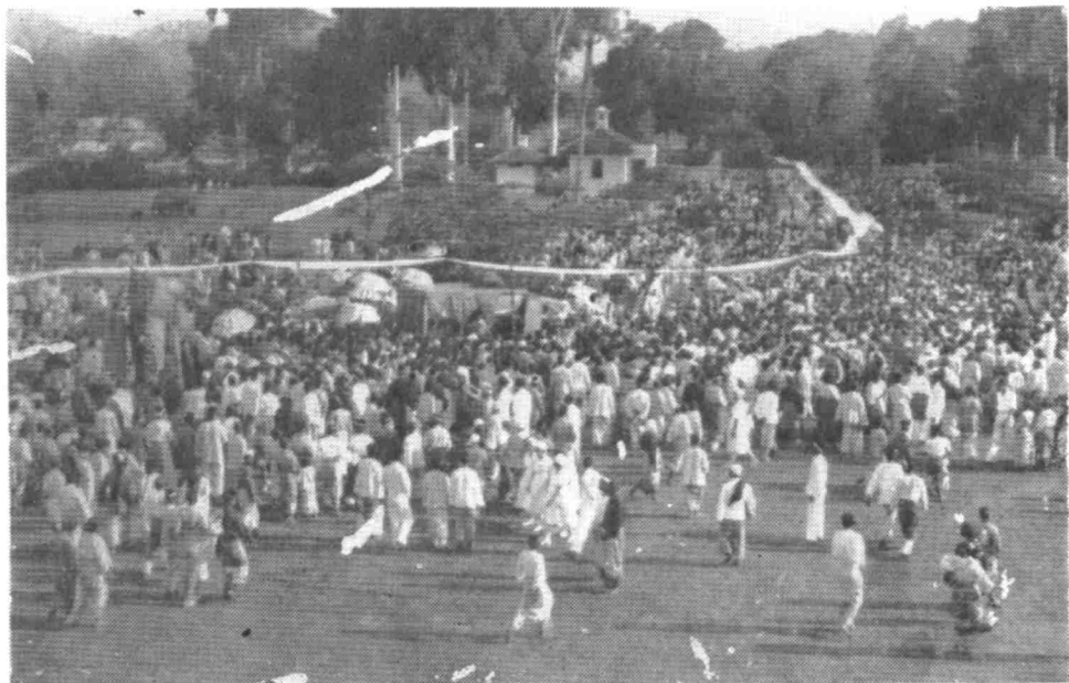
Gambar ketika Jenazah Almarhum Tuanku Muhammad Shah di-bawa ka-makam di-Raja dari Istana pada 3.8.1933.