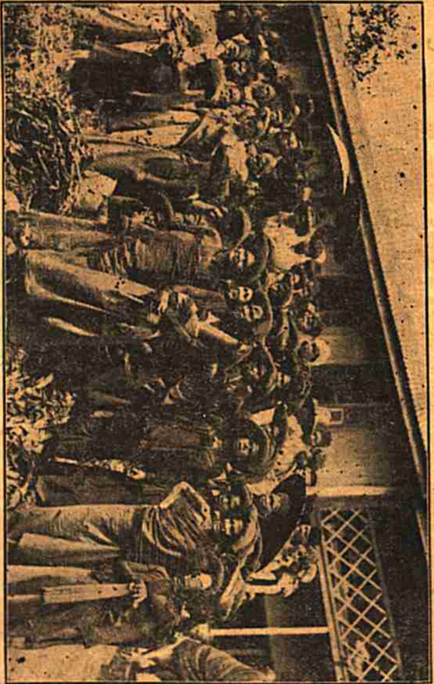
بشما باتق کارو دکابرت جاھي مراعيکن فرالاتن نيکسج کھونون