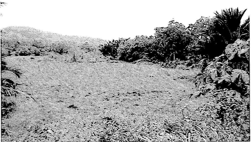
Gambar : Pemandangan tanah sawah terbiar di kampung Batu Hampar