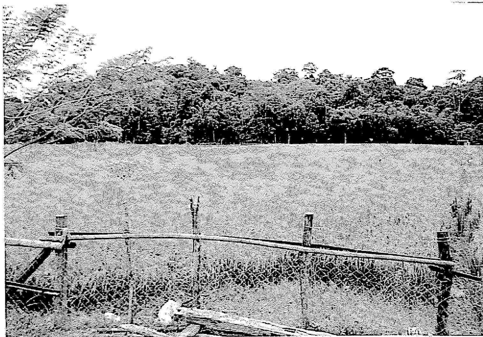
Gambar : Tanah sawah yang telah diusahakan secara berkelompok.