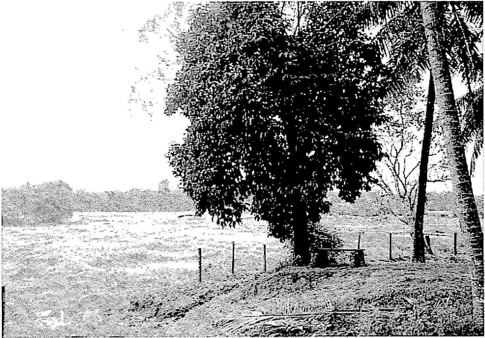
Gambar : Pemandangan tanah sawah yang terbiar di Kampung Tanjung Sena