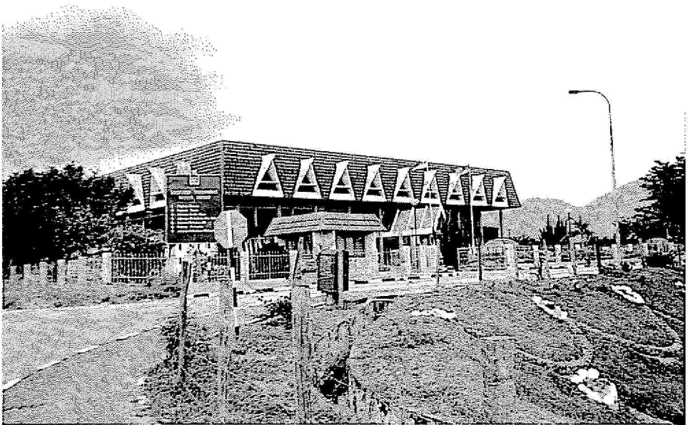
Gambar : Kompleks Pentadbiran Daerah Rembau yang menempatkan Pejabat-pejabat Kerajaan