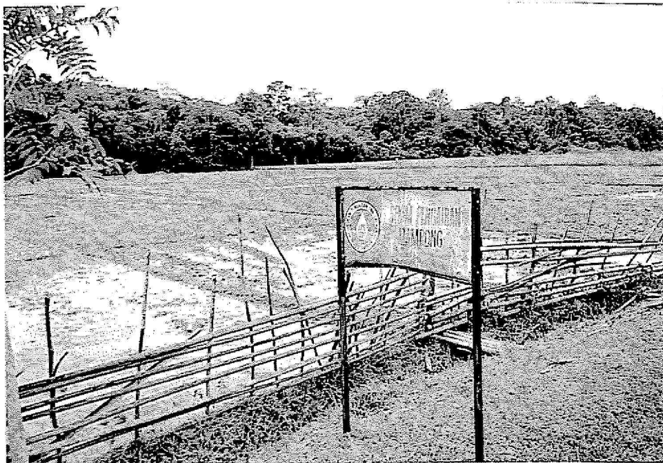
Gambar : Skim Pengairan Mampong