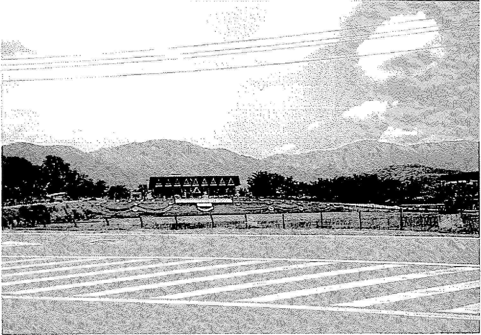
Gambar : Pemandangan Kompleks Pentadbiran Daerah Rembau Dari Jauh