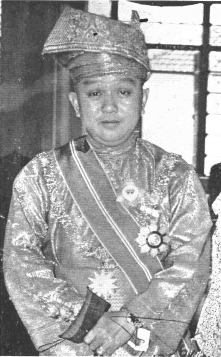
Duli Y.M.M. Tuanku Munawir S.M.N., S.P.M.B. Gambar 1959.