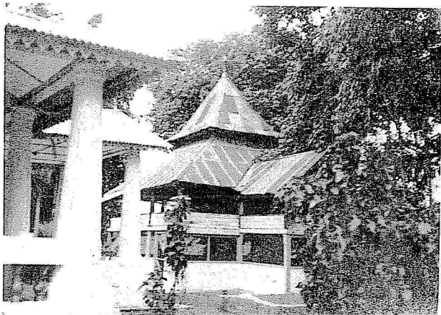
Bangunan kecil di belakang ialah masjid tua Kampung Tengah yang dipercayai setakat ini sebagai masjid tertua di Negeri Sembilan.