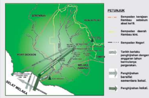
▪ Peta pergerakan penghijrah zaman awal (Abad ke-7 hingga abad 15)

Mengikut jalan Laut China dan memudiki Sungai Pahang, lalu menyusur Sungai Teriang. Mereka mendarat di Juntai dan