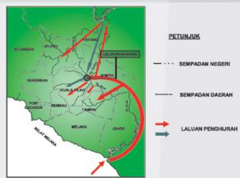
Peta pergerakan penghijrah melalui Sungai Muar. Jalan Penarikan dan Segenting Langkap.