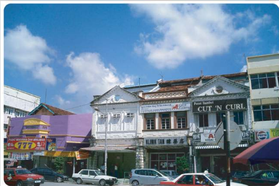
▪ Gambar Bandar Seremban.

Mulai pertengahan abad ke-20, khususnya selepas Malaysia merdeka orang yang berhijrah keluar Negeri Sembilan lagi bukan terhad kepada kaum lelaki. Gadis-gadis yang bakal menjadi ibu soko juga turut berhijrah. Generasi ini terdedah kepada kemajuan teknologi moden dan budaya adat. Kepada mereka, segala yang berkaitan dengan adat sudah ketinggalan zaman. Lantas, mereka juga tidak bersuku. Justeru itu, bilangan anggota sesuatu suku semakin merosot.