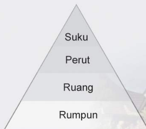
Carta Struktur Masyarakat Adat Perpatih

Upacara kodin adalah proses mengambil anak angkat. Upacara ini ada dua bentuk, iaitu kodin pinang sebatang atau kodin adat atau kodin selayar atap dan kodin aur serumpun atau kodin adat dan pusaka. Antara dua kategori ini, kodin adat dan pusaka adalah lebih tinggi tarafnya kerana mendapat keahlian penuh, berhak menyandang atau mewarisi pusaka. Kodin yang merupakan ahli biasa hanya layak untuk mengikut adat istiadat dan tidak berhak menyandang atau mewarisi pusaka. Dengan kata lain, orang kodin adat hanya menumpang bersaudara dalam suku Adat Perpatih.