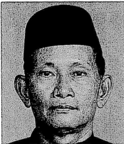
Dato' Mansor bin Subuh (Dato' Menteri)