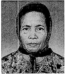
Dato' Saenah bt Ahmad (Dato' Bentara Betina)