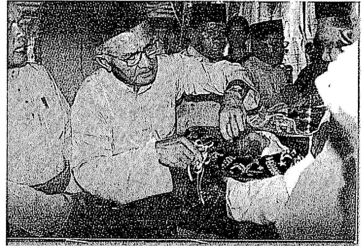
Istiadat bercukur jambul